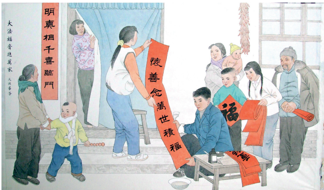
■ 繪畫：明真相千喜臨門。