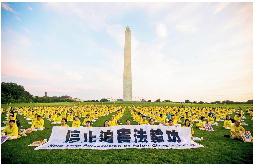
■ 美國法輪功學員在華盛頓 DC 悼念被中共迫害致死的中國大陸法輪功學員，呼籲制止中共迫害。

不僅如此，劉福璽修煉法輪大法後，做生意不坑不騙，公司辦得越來越紅火。中共迫害法輪功之前，他的公司每年少說也有十幾萬的純收入，一家人的日子過得