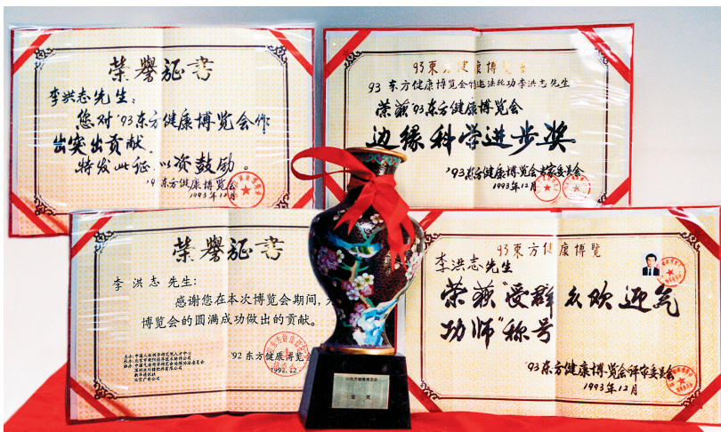
■ 1993年北京東方健康博覽會上，李洪志大師獲博覽會最高獎「邊緣科學進步獎」和大會的特別金獎，以及「受歡迎的氣功師」稱號。

一九九八年十月，對北京市200多個法輪功煉功點進行統計學調查，有效調查人數為12,731例。結果顯示，法輪功祛病總有效率為99.1%，其中完全康復