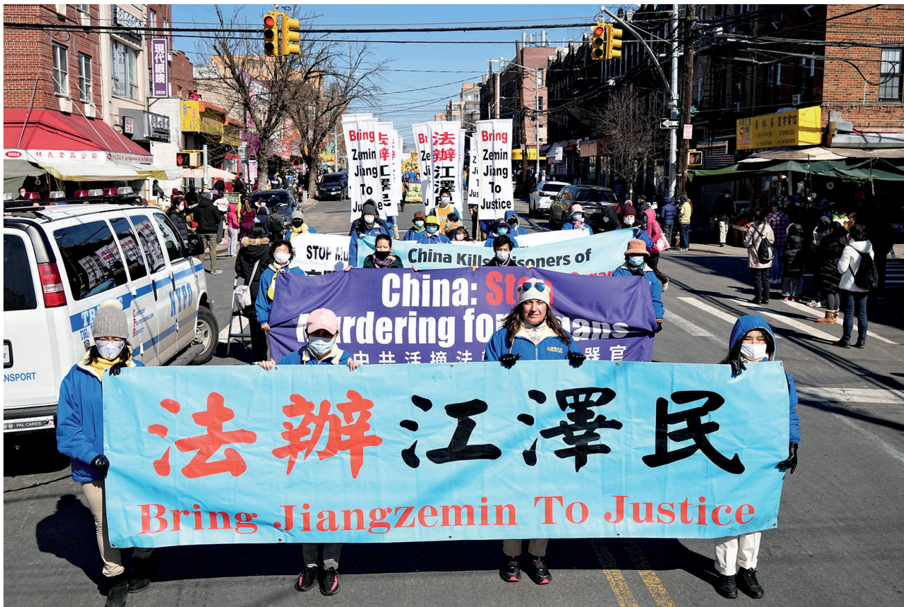
■ 2022年2月27日，法輪功學員在美國紐約布魯克林舉行盛大遊行，呼籲立即制止中共迫害，嚴懲迫害元凶江澤民及其罪惡團夥。

據明慧網《中共酷刑虐殺法輪功學員調查報告》曝光，將法輪功學員迫害致死的案例涉及全國122座監獄。傅政華作為前司法部部長，負有不可推卸的責任。