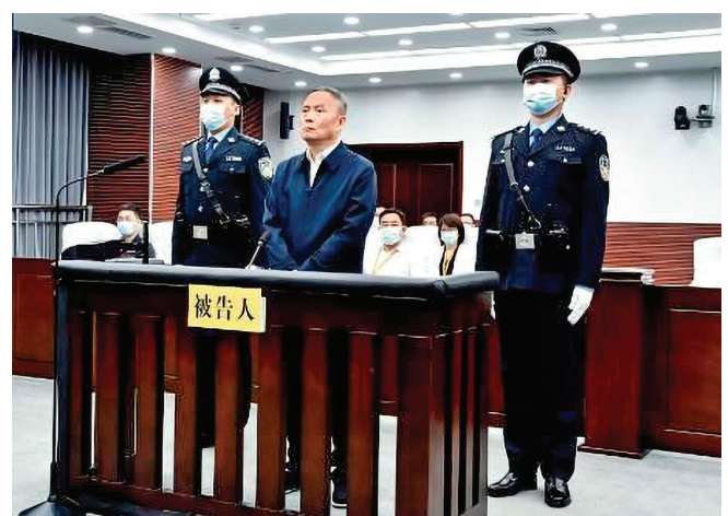
■上海市副市長、市公安局局長龔道安遭惡報被判無期。

再後來，楊隊陞遷走了。陳警也得福報，接任了楊隊的職位。楊隊走之前特意向我表示謝意，我告訴他無論在哪都要善待大法及大法弟子，自己才會有好的未來，他答應了。