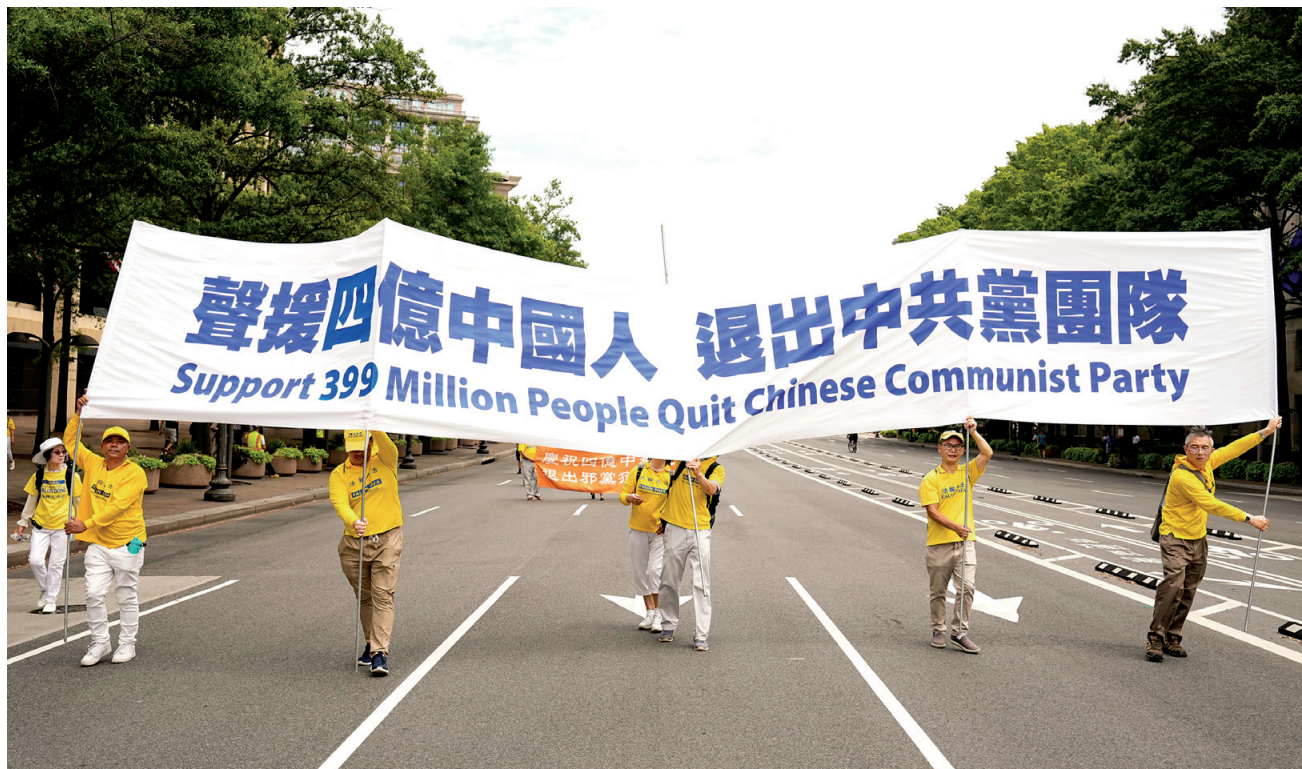
■ 二零二二年七月二十一日下午，美國東部地區部分法輪功學員在美國首都華盛頓 DC 舉行法輪功反迫害 23 週年遊行，呼籲立即制止中共迫害，聲援 4 億中國人退出中共黨、團、隊組織。

我的另一個鄰居，是我們市公安局長的兒媳婦，剛好她的女兒與小孫女兒也非常好。我的小孫女兒和她女兒一起玩兒，她女兒毫不吝惜，甚麼東西都給我小孫女兒。公安局長的兒媳婦說：「真不可思議，我女兒非常『小店兒』（吝嗇