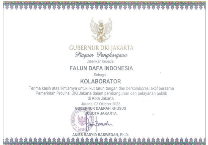
▲雅加达省长为法轮大法团体颁发的奖状

在前两年的疫情高峰期，雅加达许多公园都不对公众开放，但是当地的法轮大法学员们，通过与雅加达省府公园局的协调沟通，在遵守疫情防控相关规定的同时，仍然可以在公园举行集体炼功。同时，近几年来法轮功学员们在一些公园提供了免费的法轮大法功法教学，许多民众通过学炼法轮大法，确实感受到身心健康方面的提升，尤其是在预防新冠肺炎病毒方面的好处。雅加达首都特区省长巴斯维丹博士在奖状中写道：感谢印度尼西亚法轮大