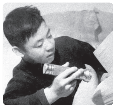
▲ 雷锋大白天用手电筒看书

“天安门自焚”按中共宣传，说是个突发事件，可从央视的录像上看，却像是根据剧情需要安排好的，摄影师使用远景、近景和特写镜头，演得像电视剧，也是漏洞百出。比如，天安门广场从没有见过背着灭火器巡逻的警察，可“自焚”发生后，仅一分多钟的时间，现场警察就拿出了20几个灭火器；“被烧伤”的小孩做了气管切开后4天接受采访时，不仅说话底气十足，还对着麦克风唱歌！◇