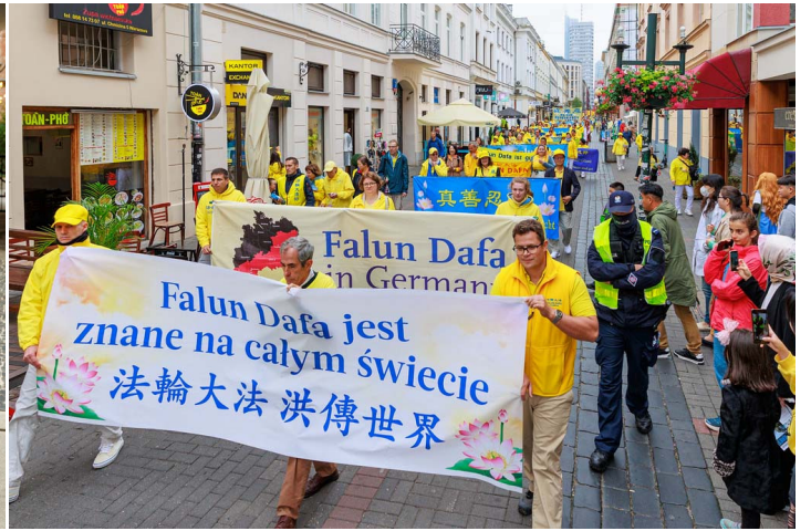
圖：二零二二年九月十日，來自歐洲三十五個國家、上千法輪功學員在波蘭首都華沙大遊行。左圖為歐洲各族裔法輪功學員打出條幅以世界多種語言展示“真、善、忍”，右圖條幅為“法輪大法洪傳世界”。法輪大法是由李洪志先生於 1992 年傳出的佛家上乘修煉大法，以宇宙最高特性“真、善、忍”為根本指導。法輪大法已經洪傳全世界 100 多個國家和地區，獲多國各級政府及組織褒獎達 5700 多項。全世界唯有中共迫害法輪功。