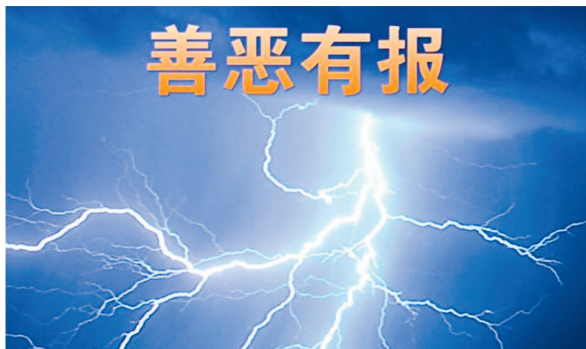
■「天安門自焚」偽案主要責任人之一、原中宣部副部長徐光春遭報喪命。

一九九九年，時任中宣部副部長徐光春公開表示，反法輪功是當年中國新聞界的四大宣傳戰役之一。一九九九年十月二十七日，徐光春在部分報紙總編輯座談會上講話，談到黨委機關報的子報、小報時，要把「揭批法輪功」作為「一