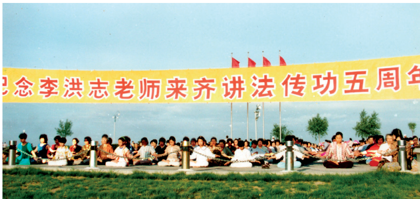
■ 迫害之前（1998年），齊齊哈爾法輪功學員集體煉功場面。