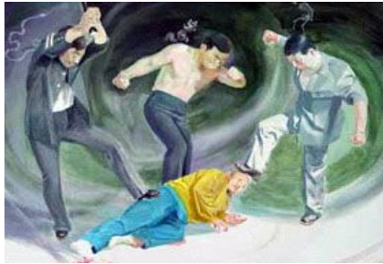
中共酷刑示意图：殴打

1996 年，他听说法轮功祛病健身有奇效，于是他抱着试试看的想法参加了看李洪志师父讲法录像的九天班，被法轮大法的法理折服