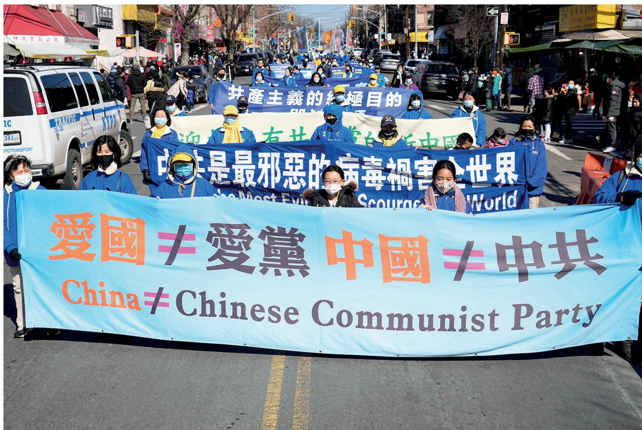
■ 2022年2月27日，法輪功學員在紐約布魯克林舉行盛大遊行，聲援中國民眾退出中共黨、團、隊組織。這條橫幅上寫著：愛國不等於愛黨 中國不等於中共。

是求你的回報，只是真心希望你和你的家人平安度過這場瘟疫劫難。尤其是你們公安干警是上當受騙，參與了這場迫害。你們以後的處境是非常危險的，因為中共會拿你們做替罪羊。」