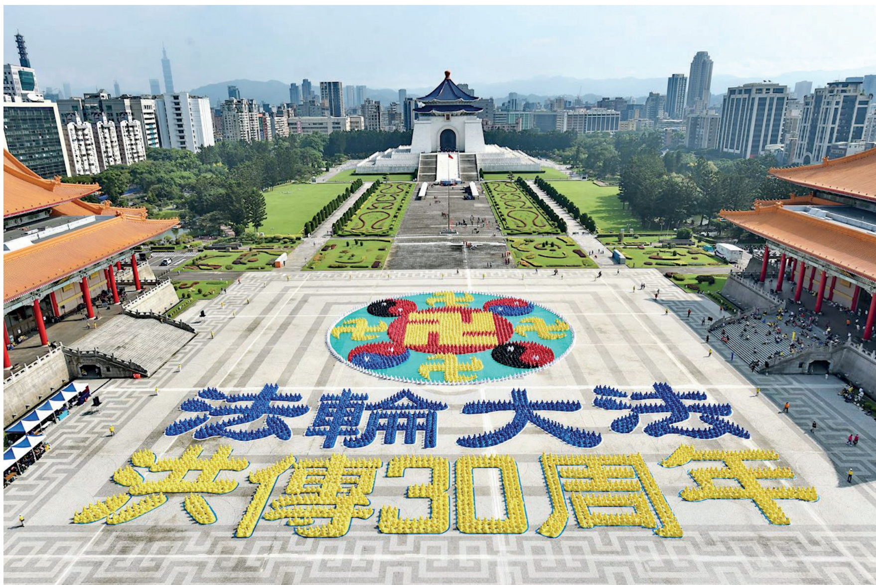
■ 二零二二年十一月十二日，近五千名法輪功學員在臺北自由廣場排出耀眼的法輪圖形和「法輪大法洪傳30週年」。