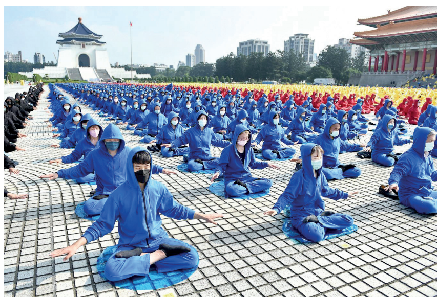
■ 近五千名法輪功學員於排字結束後，舉行集體大煉功。

持外國護照從香港來臺旅遊的大陸民眾。夫妻倆回憶自己中學時代，家鄉有非常多人煉法輪功，但是後來遭政府打壓。他們表示，如果不是有機會出國念書，在國外待了許多年，他們會跟國內的人民一樣，只聽見一種聲音，被洗腦得很徹底。他們覺得很慶幸能夠有機會在國外自由的環境，接觸到自由的訊息。