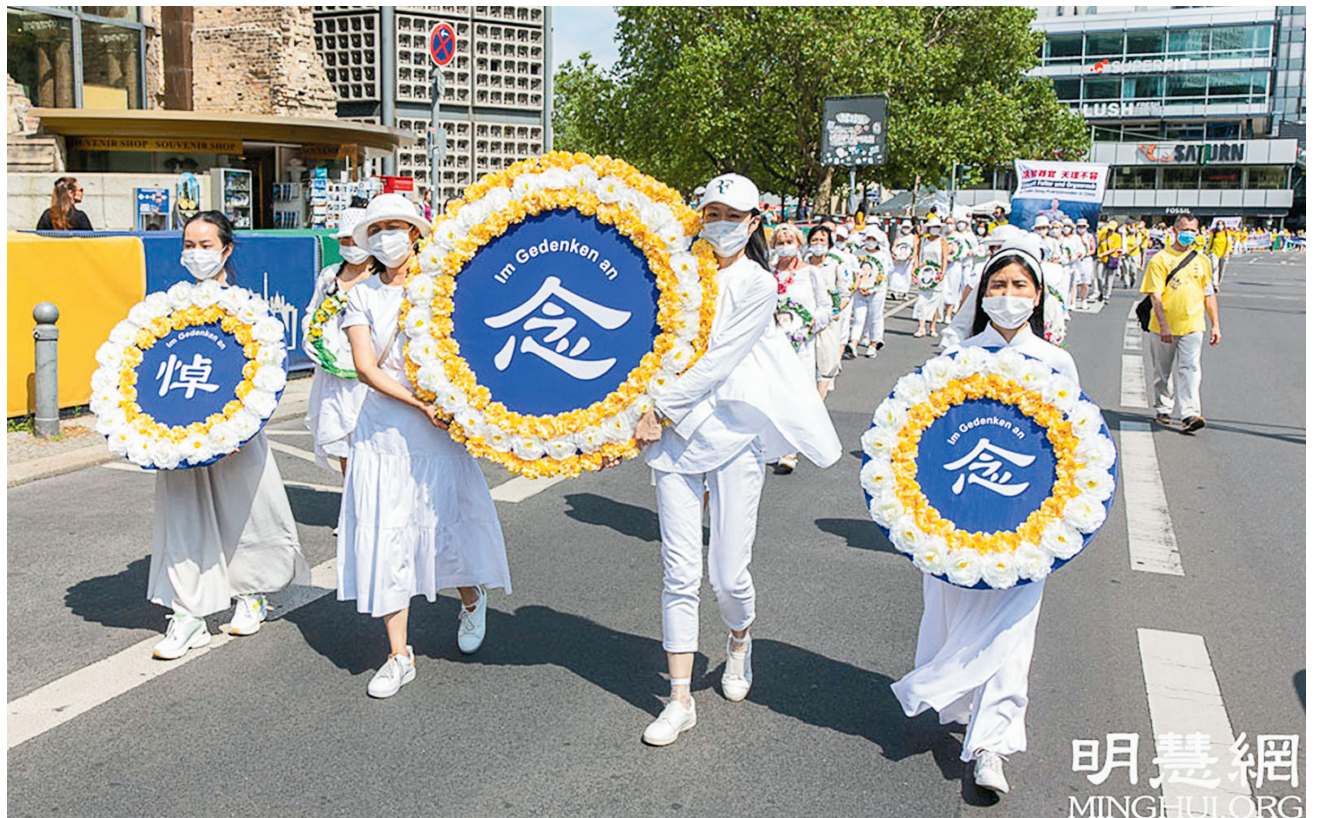
■ 2021年7月17日, 德國部分法輪功學員在柏林街頭遊行, 悼念被中共迫害致死的中國同修, 呼籲立即停止迫害。