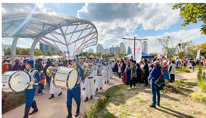
■ 韓國法輪功學員組成的天國樂團參加富川市「市民和睦慶典」大遊行活動。