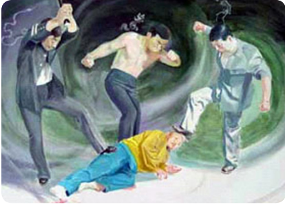
▲ 中共酷刑示意图：毒打