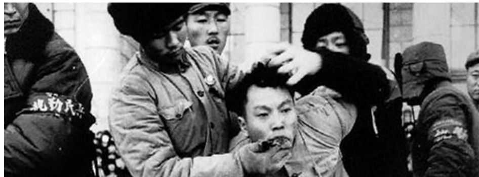
▲ 中共于文化大革命期间枪决“反革命份子”前为使之发不出声音，采用各种残忍手段“消声”。

蒋介石一生不忘“拯救中国”，不是因为他梦想反攻夺权，而是要拯救被中共毒害和毁灭的中国人及中华文明。他早在70年前就洞彻了共产主义及中国共产党的本质，看清它是一个毁灭中国、赤化世界的恶魔。遗憾的是，这一点当时并没有被中国人所知晓，因为中共建政之后屏蔽掉一切对其不利的声音。如今，我们再看蒋介石70年前的精辟分析，铮铮有声，引人深思。■