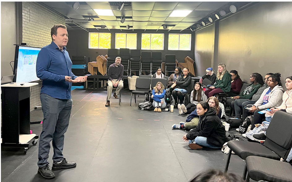
▼ 法轮功学员来到该大学世界宗教课的秋季课堂上讲述法轮功真相。