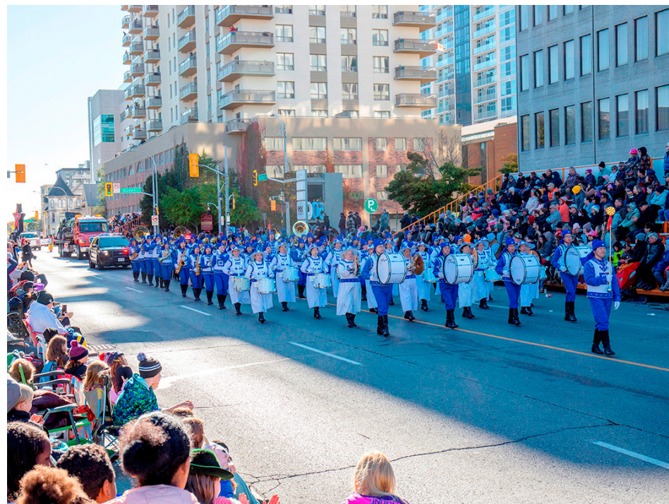
▼ 由加拿大多伦多法轮功学员组成的天国乐团，应邀参加了基奇纳-滑铁卢慕尼黑啤酒节感恩节游行。