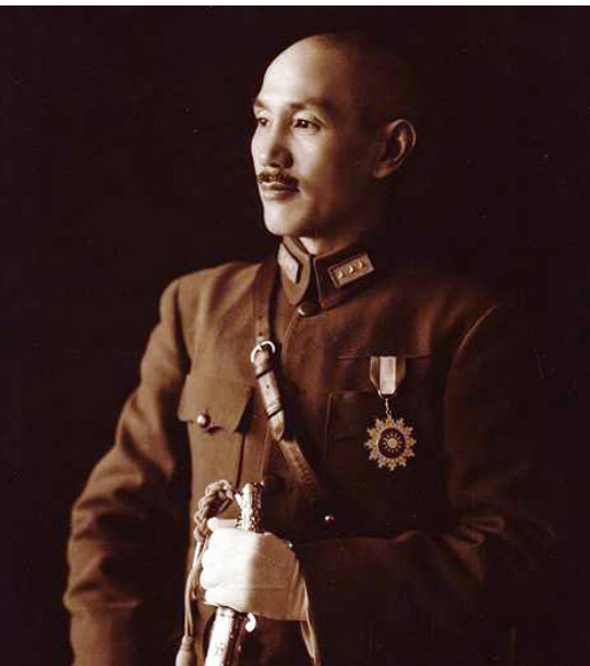
▲ 蒋介石：“现在中国人都相信他们，打没用，等中国人慢慢看清了真相，会期待我们回来的。”

石贴身侍卫回忆：“他伏在桌子上哭得很伤心，一边哭还一边叨咕，不打了，不打了，打来打去死的都是中国人，这是天要亡我，现在中国人都相信他们，打没用，等中国人慢慢看清了真相，会期待我们回来的。”