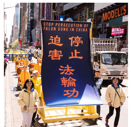
2018 年 5 月 11 日约两千名法轮功学员在纽约举行盛大游行。

根据明慧网报道统计，二零二一年，沈阳市法轮功学员被迫害离世 6 人；被非法判刑 15 人；被构陷到法院 8 人；被构陷到检察院 1 人；被绑架至少 62（其中包括 2 名为法轮功学员鸣冤的家属）；被骚扰 70 人以上，被停发养老金 7 人；仅明慧网二零二一年报道被劫入或正在被监狱迫害 13 人。◇