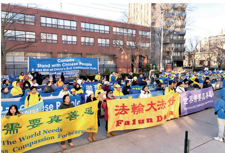
■二零二二年十二月八日多倫多法輪功學員和民眾，在安省政府大樓前舉行反迫害大型集會和遊行，譴責中共二十三年來殘酷迫害法輪功的罪惡。