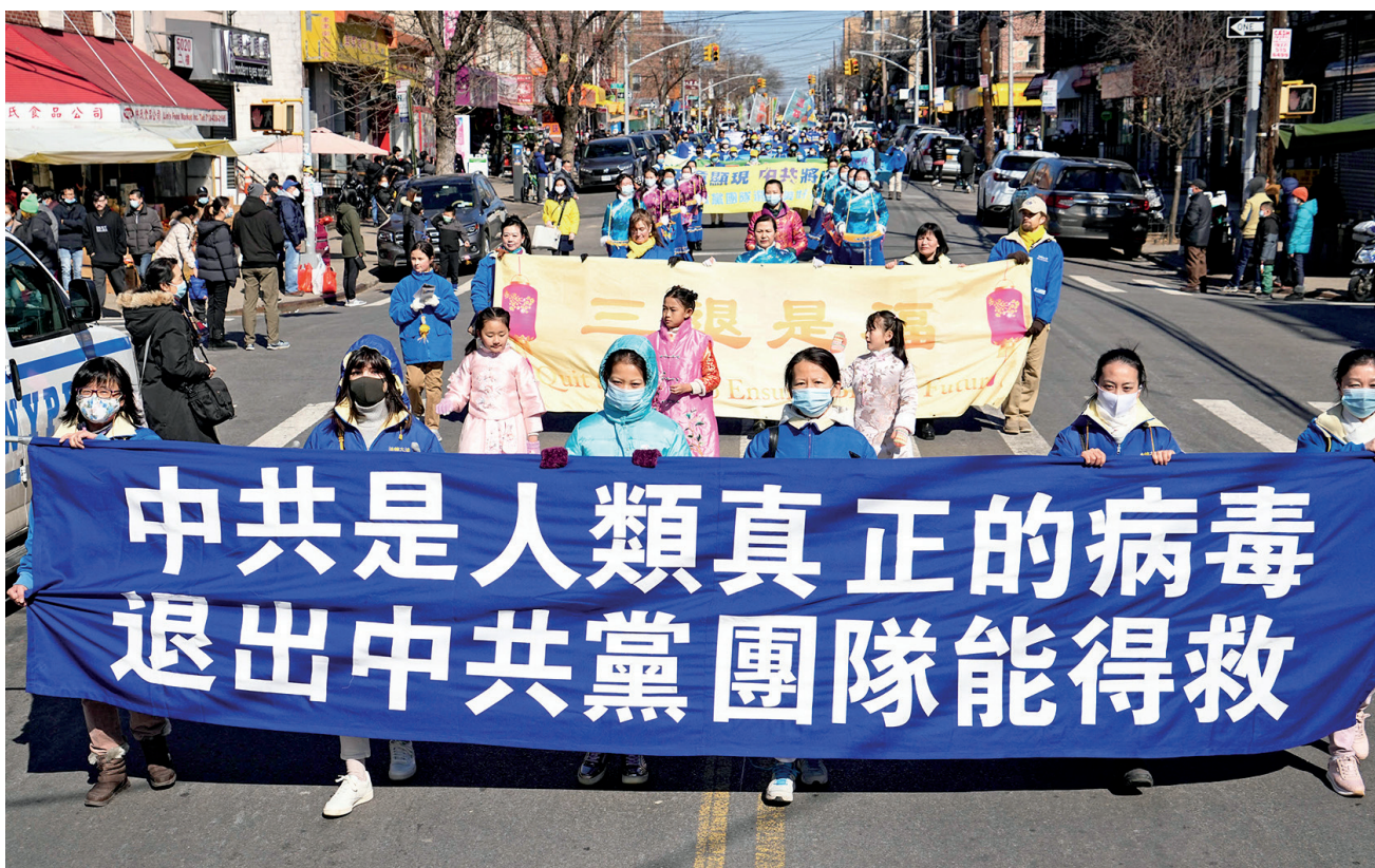
■ 2022年2月27日，法輪功學員在紐約布魯克林八大道華人社區舉行盛大遊行，聲援三退（退出中共黨、團、隊）大潮，呼籲停止迫害法輪功。

你想想，是不是人都這麼想的？這農民撓撓頭說：可不是咋的！咱也沒尋思啊，共產黨咋這麼能騙人呢？我們都被它騙了。學員說：共產黨騙人的事多了去了，從抗日、土改、鎮反、三年大飢荒、四清、反右再到文革、六四、迫害法輪功，哪個事是說真話的？你別跟它瞎跑了，退出來吧，退出來你才有好的未來。