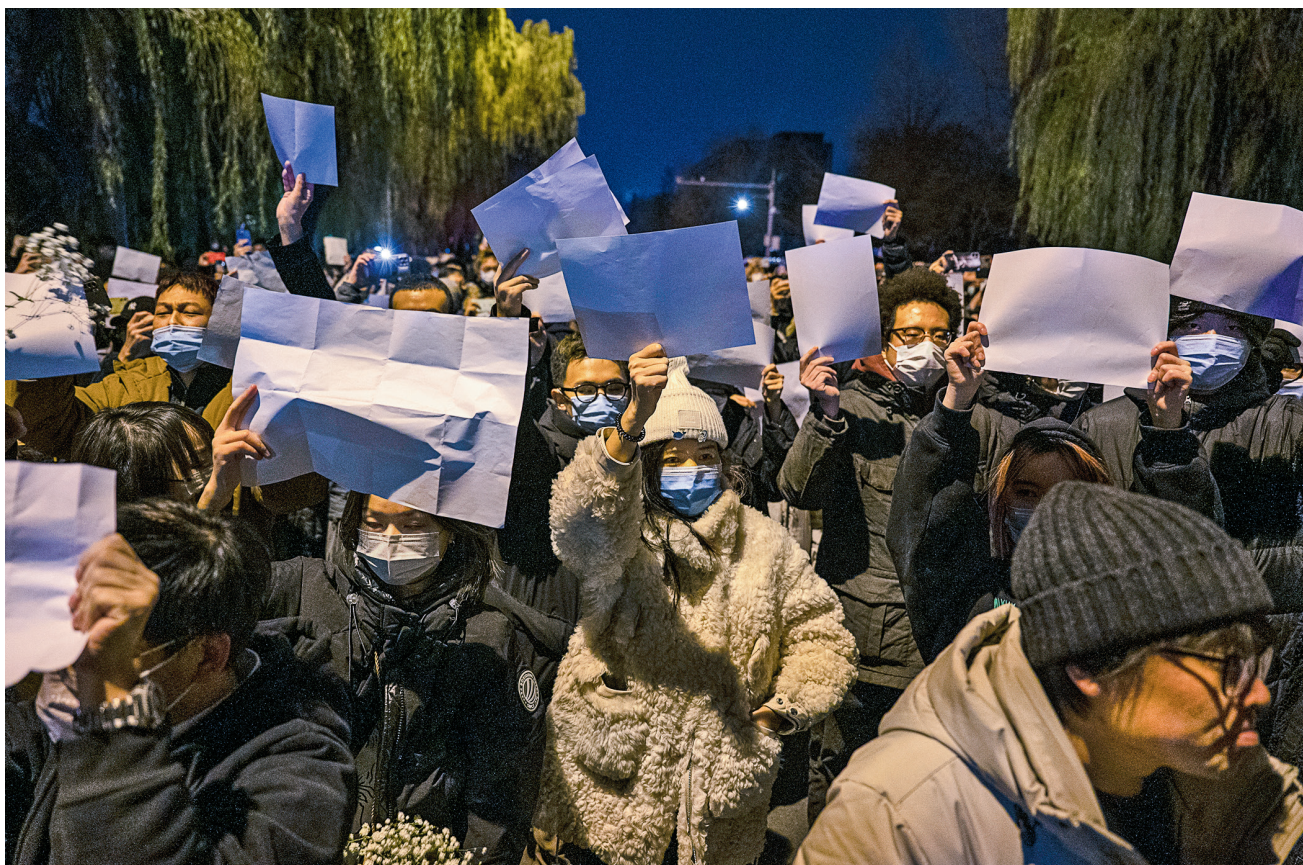
■ 2022年11月27日，在北京一場集會上，大批民眾舉白紙抗議中共。