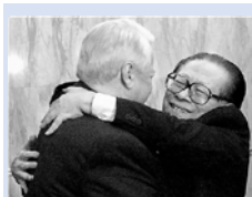
◀一九九九年十二月，江泽民在北京与叶利钦签署了卖国条约。江的献媚丑态。