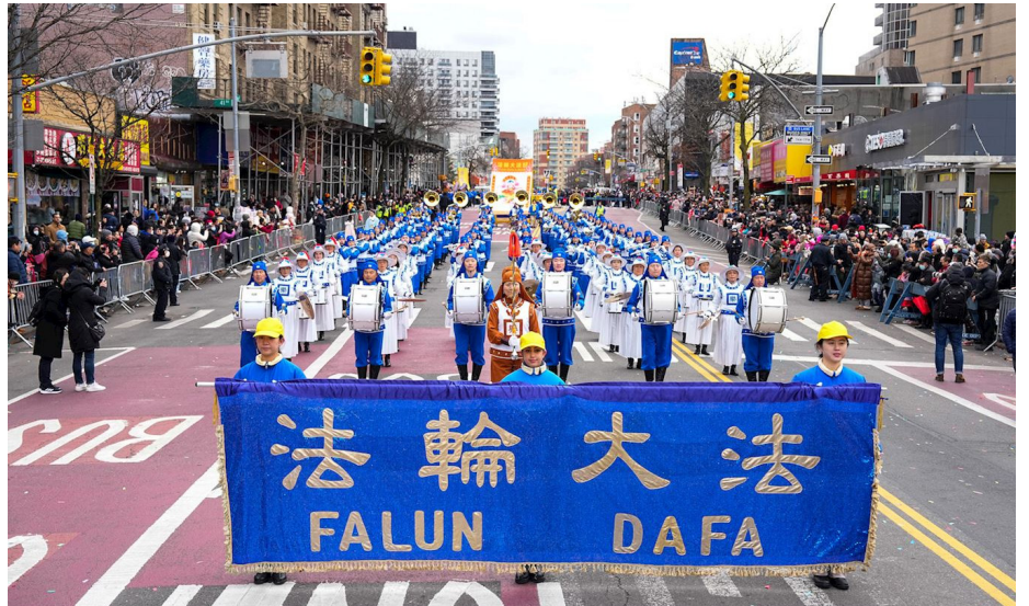
图：2023年1月21日，纽约市最大的华人社区法拉盛，举行庆祝癸卯兔年的新年大游行。纽约部分法轮功学员组成的法轮大法方阵，阵容壮观亮丽，赢得了民众的普遍赞誉。有大陆新移民表示“法轮功是在拯救人类”。

我高兴的欢天喜地。我为什么这样高兴？睡觉对正常人是平常事，对失眠三年的我可是大灾难，