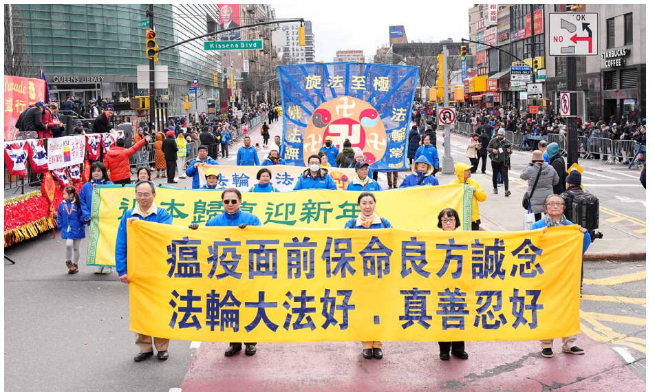
图:2023年1月21日,法轮功团体参加纽约法拉盛新年游行,送去人在瘟疫面前得救的真言——“法轮大法好,真善忍好”和美好的祝福。法轮功也称法轮大法,至今已弘传100多个国家和地区,创始人李洪志先生和法轮大法获得各国政府各类褒奖、支持决议案和信函超过5700项。

同时,在法轮功遭到中共诬蔑迫害时,人还能明辨是非,支持善良,这就是最珍贵的一念,就会得到上天的庇佑,因为“人心生一念,天地尽皆知”。因为相信法轮大法好,危难时刻诚念九字吉言化险为夷的例子很多,所以被明白这个真相得福报获新生的人们尊为“吉言”。◇