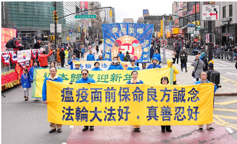
图:2023年1月21日,法轮功团体参加纽约法拉盛新年游行,送去人在瘟疫面前得救的真言——“法轮大法好,真善忍好”和美好的祝福。法轮功也称法轮大法,至今已弘传100多个国家和地区,创始人李洪志先生和法轮大法获得各国政府各类褒奖、支持决议案和信函超过5700项。

同时,在法轮功遭到中共诬蔑迫害时,人还能明辨是非,支持善良,这就是最珍贵的一念,就会得到上天的庇佑,因为“人心生一念,天地尽皆知”。因为相信法轮大法好,危难时刻诚念九字吉言化险为夷的例子很多,所以被明白这个真相得福报获新生的人们尊为“吉言”。◇