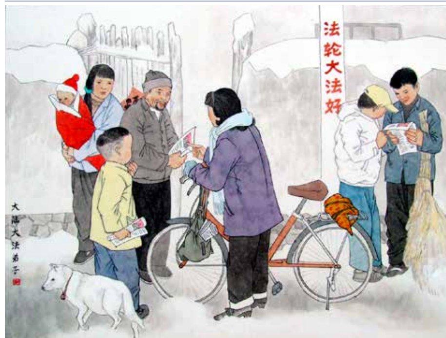
■ 绘画：大法福音救世人

三退保平安。当我拿出刊有李洪志师父经文的《明慧周报》给他看时,只见他眼睛一亮,说:“我要这个!”他恭恭敬敬地站直,郑重地说:“谢谢你!谢谢李洪志大师!”他退出了曾经加入的少先队。我把周报放在他的衣袋里,叮嘱他要珍惜!