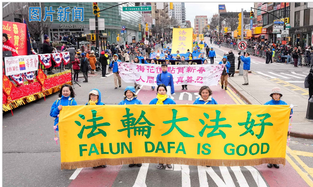
图：2023年1月21日，法轮功团体参加美国纽约法拉盛新年游行，法轮功学员打出三十多条幅送民众美好祝福。本图展示“法轮大法好”、“梅花亿点贺新春 人间处处真善忍”。

法轮功也称法轮大法，至今已弘传世界100多个国家和地区，创始人李洪志先生和法轮大法获得各国政府各类褒奖、支持决议案和信函超过5700项。