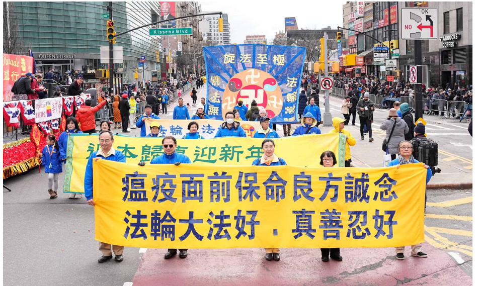
图：2023年1月21日，法轮功团体参加纽约法拉盛新年游行，送去人在瘟疫面前得救的真言——“法轮大法好，真善忍好”和美好的祝福。法轮功也称法轮大法，至今已弘传100多个国家和地区，创始人李洪志先生和法轮大法获得各国政府各类褒奖、支持决议案和信函超过5700项。

据目击者称，在其妹妹去她姐家之前，警察已经进入其姐家中，如何进入不得而知。详情有待核实。◇