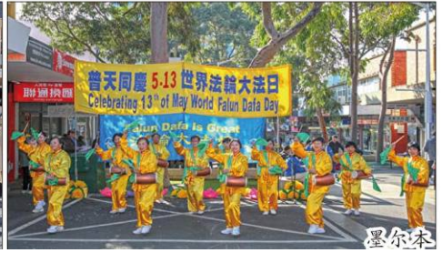
图：法轮功也称法轮大法，已弘传世界 100 多个国家和地区，受到各地民众和政府的欢迎。法轮大法造福人类，被称为“高德大法”，创始人李洪志先生和法轮大法获得各国政府褒奖、支持决议案和信函超过 5700 项。