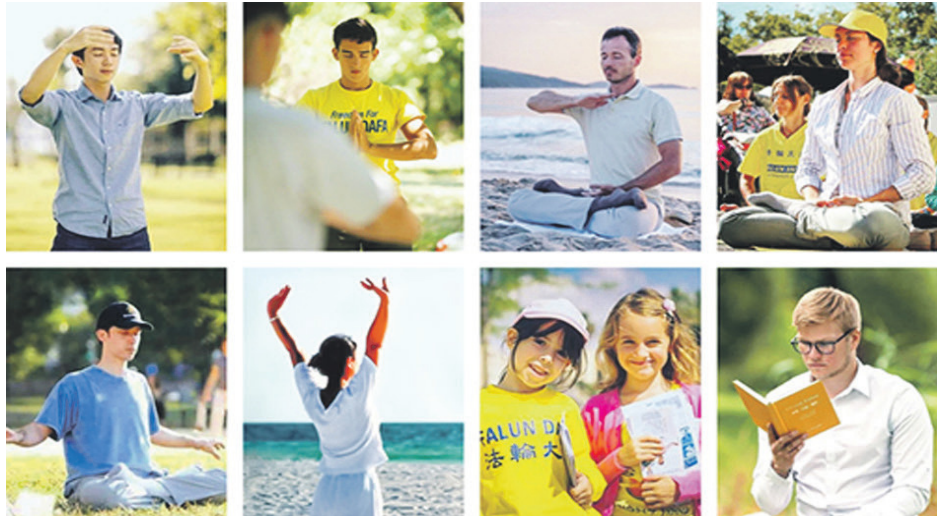
▲相较于中共的残酷迫害，法轮功却在海外迅速弘传，并获各类褒奖、支持议案和信函5,700多项。图为中国以外地区的法轮功学员。

中共在迫害法轮功的过程中一直在以权代法，根本没讲过法律。中共为了制造迫害借口，导演了“天安门自焚”等诸多假新闻。这恰恰暴露了中共“假恶斗”的本质。◇