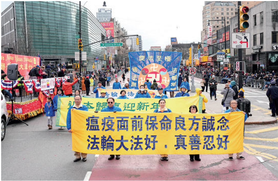
图：2023年1月21日，法轮功团体参加美国纽约法拉盛新年游行，法轮功学员打出三十多条幅送民众美好祝福。

本图展示游行队伍为人们送去让人得救的真言：“法轮大法好，真善忍好”和美好的祝福。