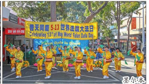
图：法轮功也称法轮大法，已弘传世界100多个国家和地区，受到各地民众和政府的欢迎。法轮大法造福人类，被称为“高德大法”，创始人李洪志先生和法轮大法获得各国政府褒奖、支持决议案和信函超过5700项。