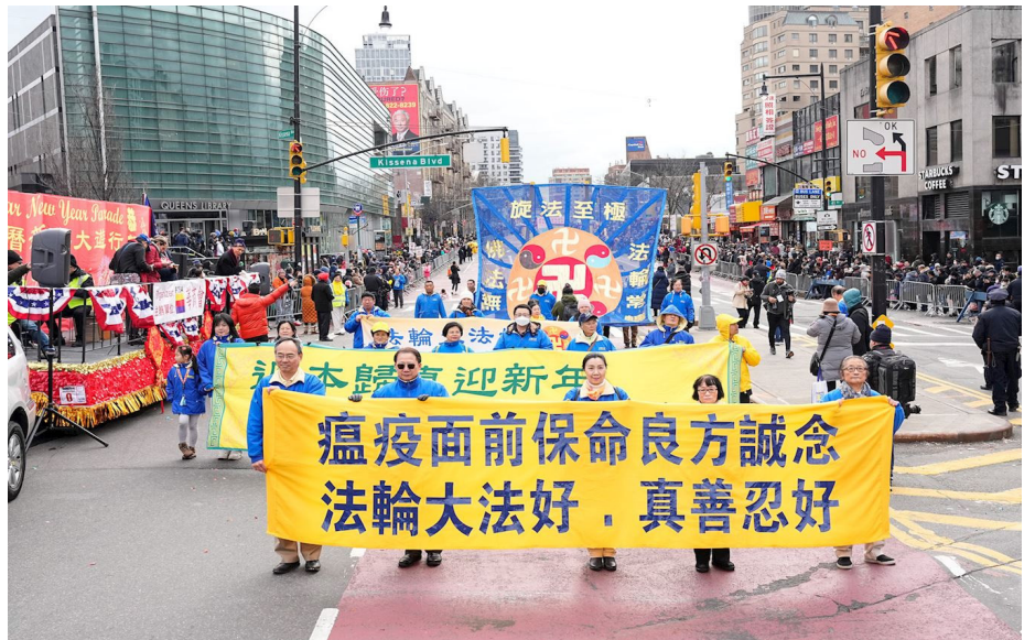
图：2023年1月21日，纽约市最大的华人社区法拉盛，举行庆祝癸卯兔年的新年大游行。纽约部分法轮功学员组成的法轮大法方阵，阵容壮观亮丽，赢得了民众的普遍赞誉。有大陆新移民表示“法轮功是在拯救人类”。

人为什么会得病？人类社会为什么会发生瘟疫？说到底与人的道德息息相关。道教陈抟老祖在《心相篇》中讲：“瘟亡不由运数，骂地咒天。”《名医叙病论》曰：“世人不终耆寿，咸多天殁者，皆