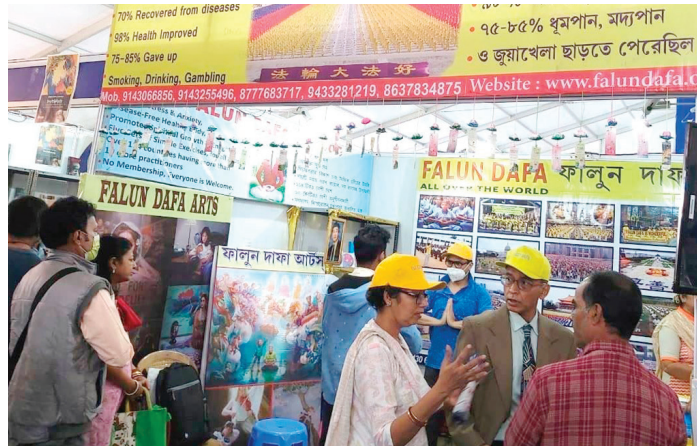
▲印度法轮功学员应邀参加加尔各答书展。