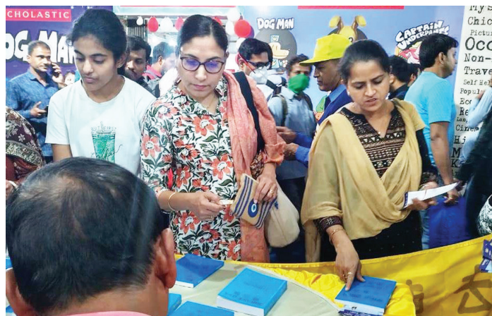
▲书展上很多人被法轮功书籍所吸引。