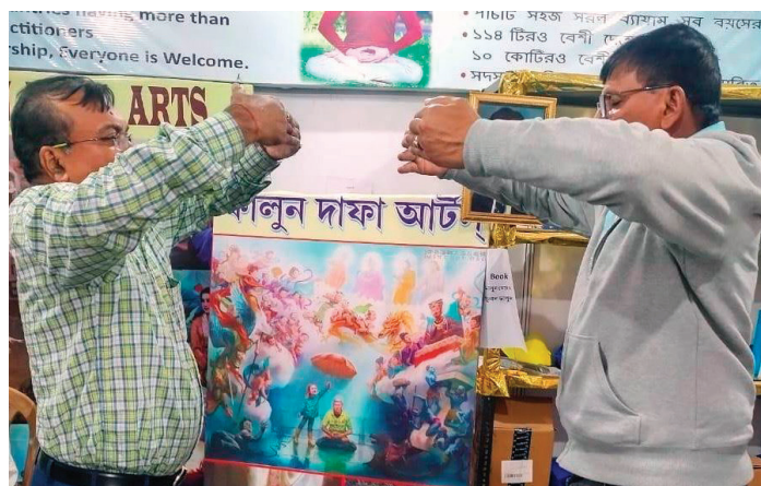
▲法轮功学员在书展上义务教功。

器官的暴行后感到震惊，并要求提供证据。学员给了他《九评共产党》一书，请他阅读活摘器官的独立调查报告，并访问明慧网。他看到“真善忍美展”的画作后，很受感动。