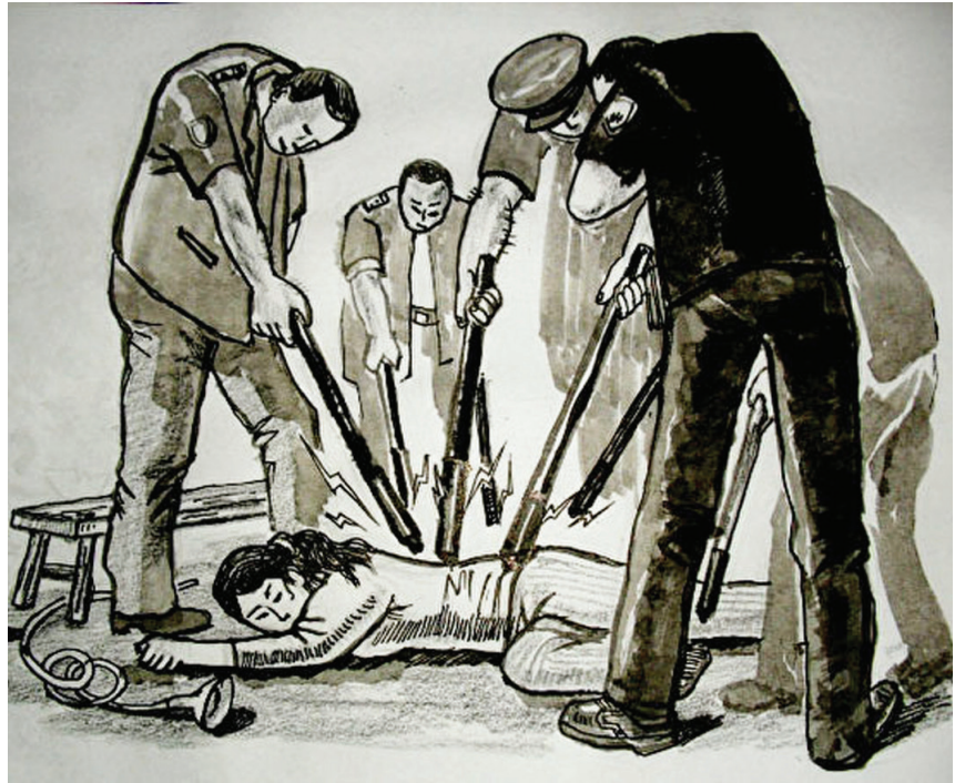
▲ 中共酷刑示意图：多根电棍电击。

近日，一名大陆警察接到北美退党（退出中共党、团、队）服务中心义工的讲真相电话。录音显示，在疫情真相和身边恶报事实面前，这名警察终于醒悟，并主动揭露了当地针对法轮功学员的酷刑迫害。