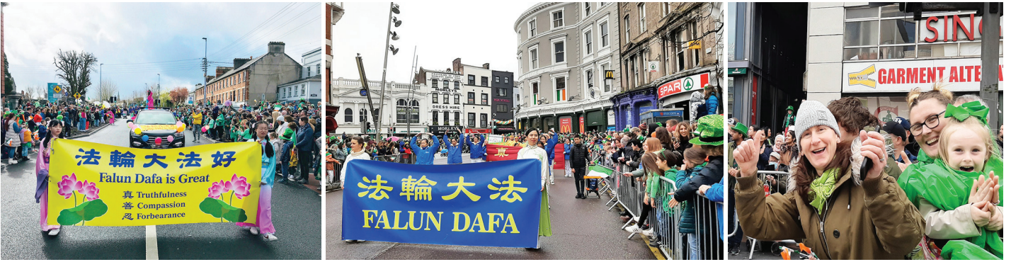
▲ 2023年3月17日，爱尔兰法轮功学员应邀参加科克市“圣帕特里克节”大游行，队伍经过时民众鼓掌欢呼。