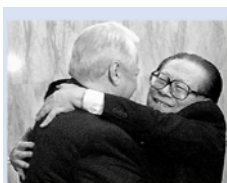
◀一九九九年十二月，江泽民在北京与叶利钦签署了卖国条约。江的献媚丑态。