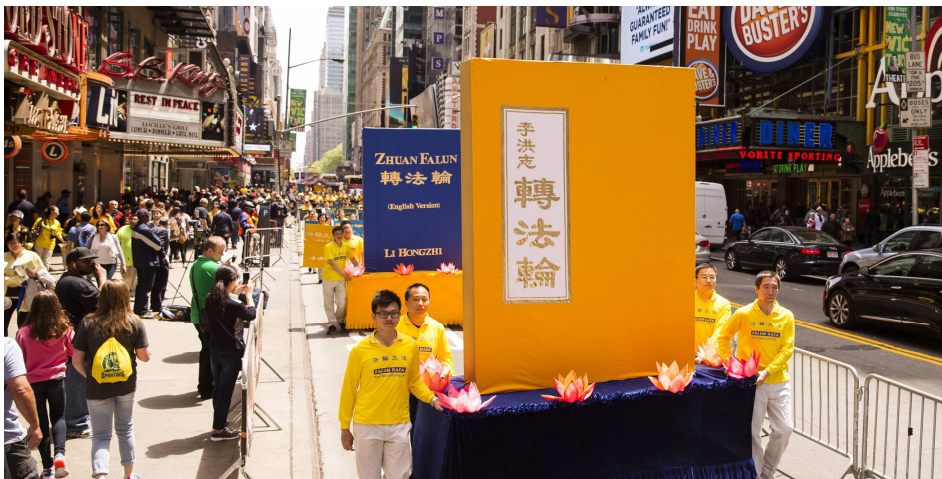
图：纽约法轮功学员在美国曼哈顿繁华华街游行，图为巨型《转法轮》书模。法轮功也称法轮大法，是由李洪志先生传出的佛家上乘修炼大法。目前已弘传世界 100 多个国家，获各国各界褒奖 5700 多项。《转法轮》被译成 40 种文字，在全球传播。

“我觉得现在的社会乱得都不是人的社会了，动物都不如了。所以法轮功真的是中国的唯一希望。”◇