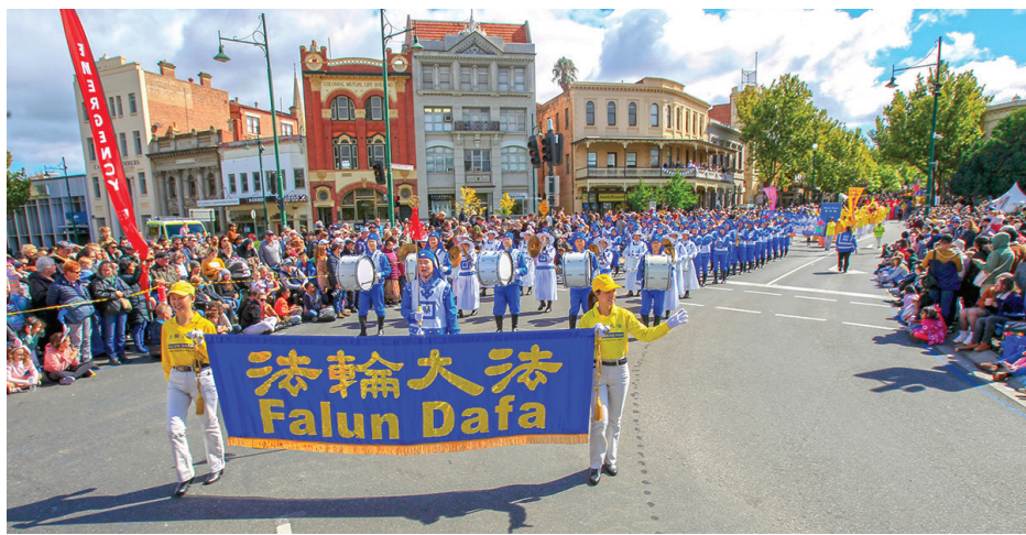
▲ 逾百法轮功学员，参加了睽违四年的本迪戈复活节盛装大游行

法轮功团体今年再次获邀参加。来自墨尔本和悉尼的部分学员，以色彩绚丽、丰富多彩的演出向当地民众传递着法轮大法的美好福音。