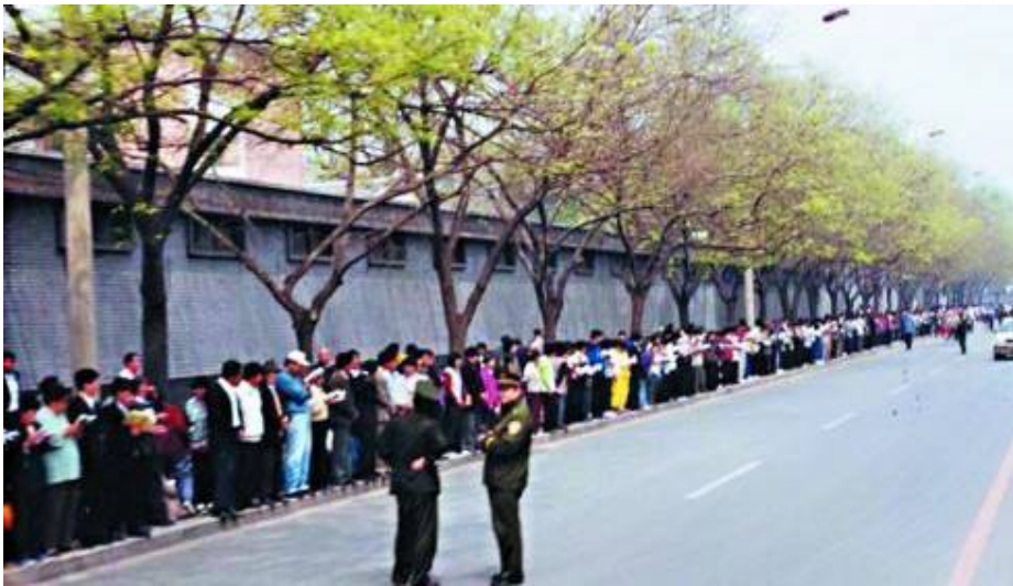
图：1999年4·25万人上访，自始至终上访现场秩序井然，展示了法轮功学员和平理性的境界及他们维护正义良知的道德勇气。

●2001年8月14日联合国会议上，国际教育发展组织就“天安门自焚”事件强烈谴责中共当局的“国家恐怖主义行为”。声明说：录像分析表明整个事件是政府一手导演的。面对铁证如山的事实，会议上的中共代表一句话也说不出。