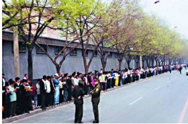
图：1999年4·25万人上访，自始至终上访现场秩序井然，展示了法轮功学员和平理性的境界及他们维护正义良知的道德勇气。

中共迫害在先，法轮功学员依法上访在后。中共对法轮功的打压在1996年就已经开始。1996年6月17日《光明日报》发表评论文章，诋毁法轮功。之后新闻出版署禁止出版发行《转法轮》、《中国法轮功》等法轮功书籍。