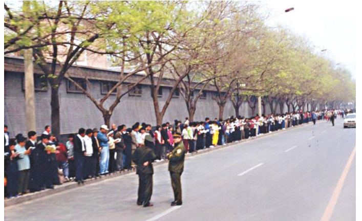
▲1999年4月25日，万名法轮功学员和平请愿现场，执勤警察在闲聊。

“4·25”上访的和平解决，受到国际社会的称赞，也为世界舆论所惊叹和称颂。当年荷兰媒体曾报导说：“我们荷兰有一个记者在4·25当天亲自到中南海采访法轮功学员。他写道：这是一支品德高尚的