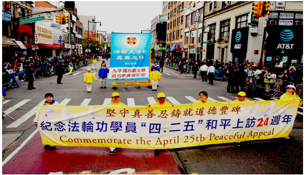
图：▲法轮功学员在纽约法拉盛举行盛大游行，纪念“四·二五”和平上访二十四周年

• 法轮功书籍中明确指出杀生和自杀都是有罪的，真正的修炼人绝不会杀生或自杀、自焚的。所有法轮功书籍和音像资料都可以从互联网上免费下载。海外有很多关于法轮功的正面报道。然而中共在迫害伊始就大量销毁法轮功书籍，并在互联网上封锁一切关于法轮功的正面信息，把和法轮功有关的词汇都设成敏感词，就是害怕人们了解事实真相。◇