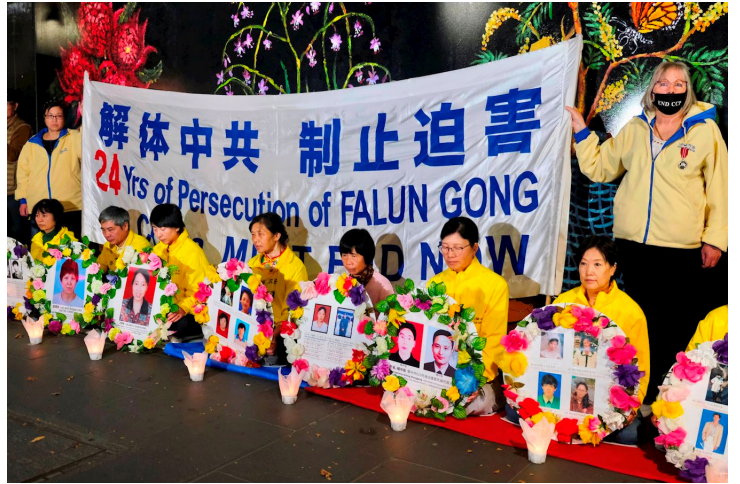
图：2023年4月25日晚，澳洲墨尔本部份法轮功学员举行烛光夜悼，纪念“四·二五”和平上访二十四周年。