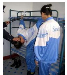
中共酷刑演示图：面壁罚站、电棍电击、吊铐在床栏上