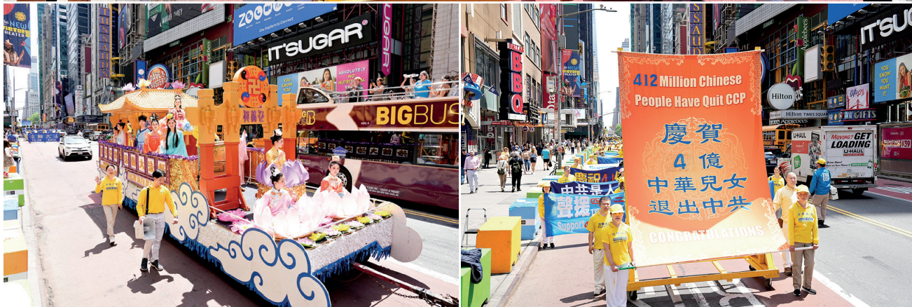
二零二三年五月十二日，大紐約地區的部份法輪功學員約五千人，在曼哈頓舉行盛大遊行，慶祝「5.13」世界法輪大法日，並恭祝法輪功創始人李洪志先生華誕。