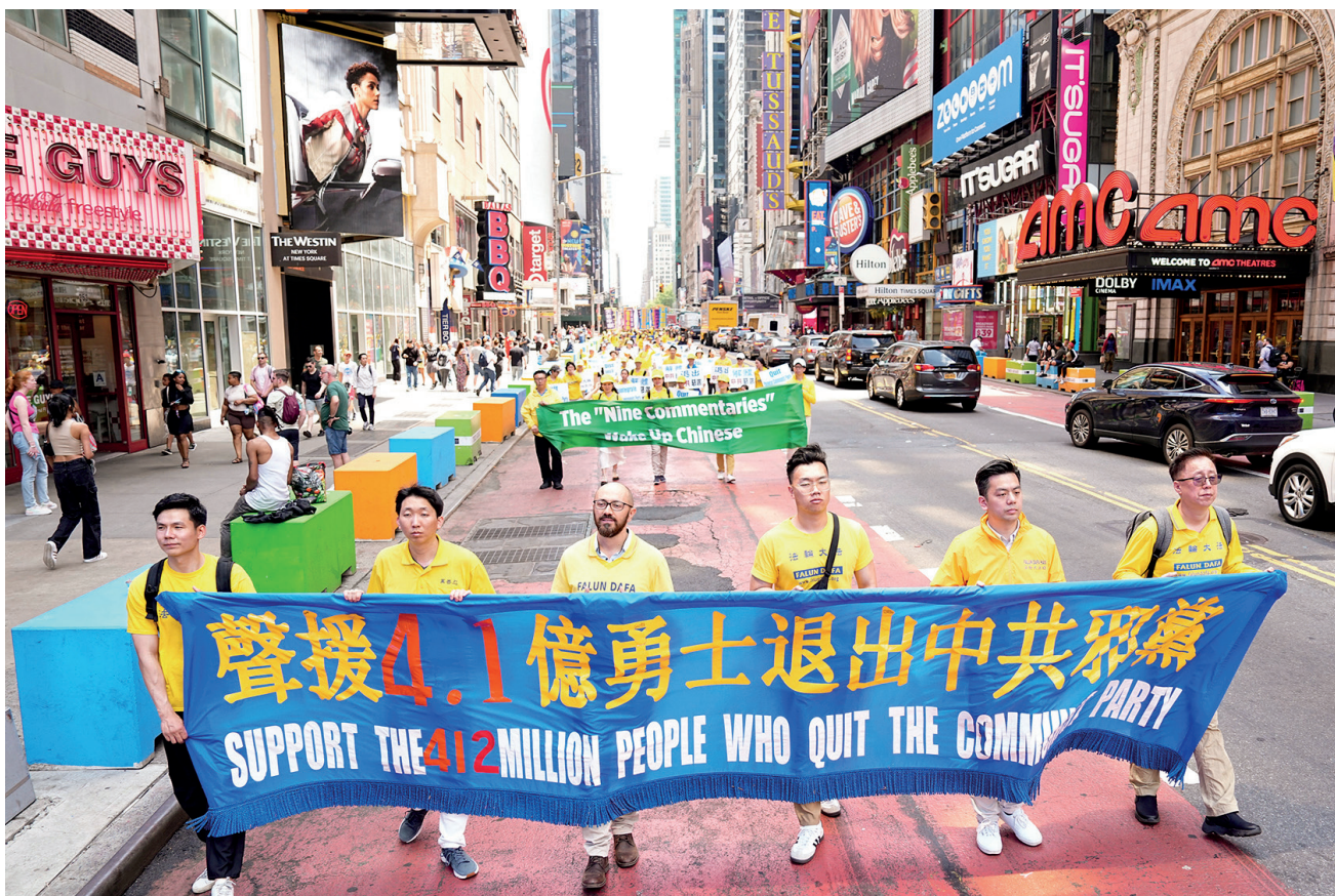
■ 二零二三年五月十二日，大紐約地區部分法輪功學員約五千人，在曼哈頓舉行了盛大遊行，慶祝「5.13」世界法輪大法日，恭祝法輪功創始人李洪志先生華誕。並聲援4億多中國民眾退出中共黨、團、隊組織（三退）。

我繼續說：「古人說『德是流通的貨幣』。人有德，不該失去的東西陰差陽錯地它還會回來，一切順其自然。」他點頭，對我所說的表示認可。我緊接著給他講了法輪大法的美好，法輪功教人向善，要求修煉者從做好事做起，努力按照真、善、忍標準提升道德水平，使人變得越來越誠實、善良、寬容、平和，於國於民有百利而無一害。而以江澤民爲首的中共邪惡集團，抵觸真、善、忍普世價值，灌輸「一切向錢看」，導致人心道德急速下滑，坑蒙拐騙，貪、黃、毒、賭，背信棄義，假冒偽劣