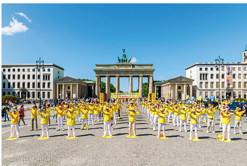
■二零二三年五月十三日，德國部分法輪功學員在柏林布蘭登堡門前集會，慶祝法輪大法弘傳三十一週年。

這一天也是法輪功創始人李洪志師父的生日。法輪功學員在廣場上表演腰鼓、舞獅、合唱，活動氣氛歡快熱烈，吸引了許多當地民眾和遊客駐足觀看。下午四點，盛大的遊行隊伍從布