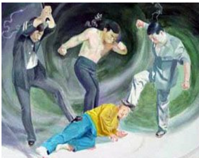
中共酷刑示意图：殴打

吸毒犯人殴打。二零零二年十二月下旬，有人看到她的嘴唇和鼻孔之间有一道深深的伤痕。