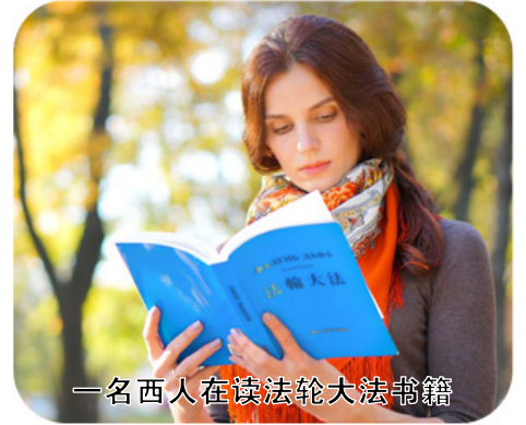
一名西人在读法轮大法书籍

一次吃过午饭，我在屋里给姐姐读法，道边聚集的一群大姑娘、小媳妇，也都跟着听，都说：这法咋这么好呢，都是教人向善的。有两个来村里给鸡打预防针的人，到我家时，进屋看见柜上放的大法书，拿过来就看上了，看了很久才想起来给鸡打针的事。