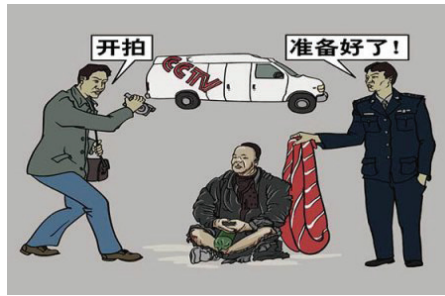
▲ CCTV 造假示意图。

民众已经开始厌倦并反对中共对法轮功修炼者的残酷打压，打压难以为继。“自焚案”的抛出，挑起了民众对法轮功的仇恨。人们由同情法轮功修炼者变为认同镇压。此后，所发生的仇恨法轮功的案例明显增加，对法轮功学员的迫害更加严重。