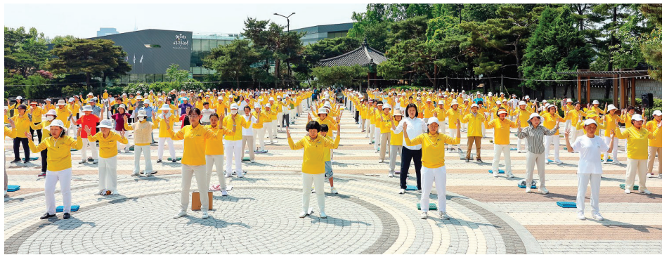
▲ 2023年5月13日，韩国首尔部分法轮功学员在青瓦台集体炼功弘法。

适应了出家人的生活，如果还俗，不知道该如何谋生。最担心的是家人会如何看待自己。但是出乎意外的是家人很理解自己，平静地接受我的决定。那时我才悟到，活到现在，我太在意别人对自己的看法了。”