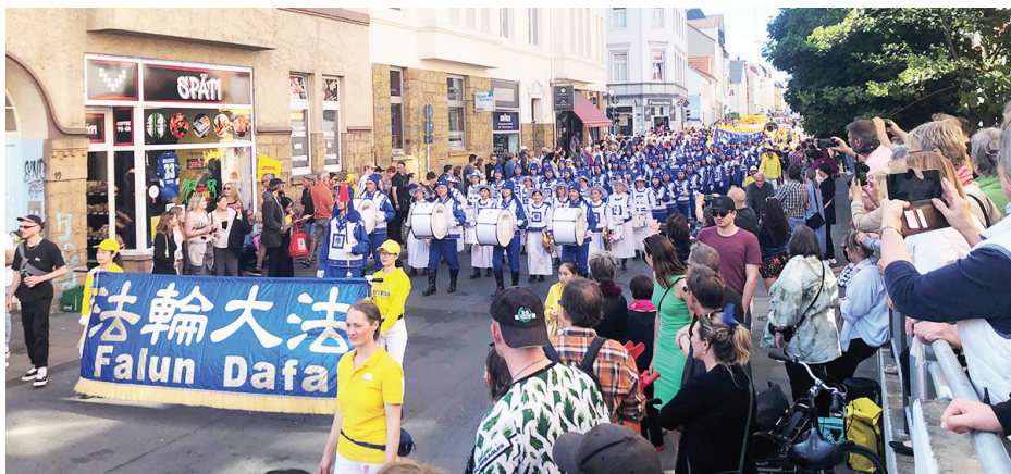
▲ 2023 年 6 月 3 日，法轮功学员参加了德国比勒费尔德市第二十五届文化游行节。

游行的民众来到真相点想更多了解法轮功，当得知中共迫害善良无辜的修炼人后，人们纷纷为支持反迫害签名。