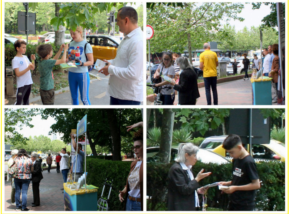
图：二零二三年五月二十七日，来自布加勒斯特的部份法轮功学员在拉姆尼库·萨拉特广场弘法和讲真相。