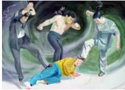
图2: 中共酷刑示意图: 暴力殴打 (绘画)

家属于二零二三年四月十四日给鞍山市中级法院写了申诉书,希冀法官为维护法律的公平正义为老百姓着想,依法澄清事实,撤销判