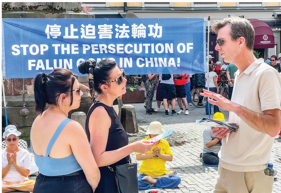
▲ 瑞典法轮功学员（右一）向民众讲真相

他对学员说：“但我没想到在这个地方遇到了你们，法轮功的祥和、你们这种和平理性的抗争，震撼人心。我知道你们告诉人们的（活摘器官）都是真的。我在从事人体解剖的研究中，发现很多有钱人为了延长生命，器官都是换过的，一看就知道那些移植过来的器官都是年轻人的，与实际年龄根本不匹配。”