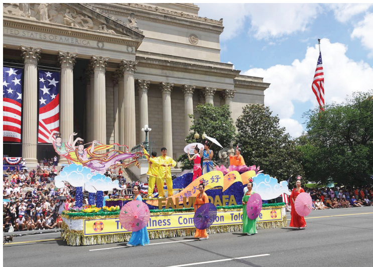
▲ 青年法轮功学员在花车上展示法轮功功法。

【明慧网】2023年7月4日，法轮功团体再次入选参加今年美国首都华盛顿的独立日游行。来自各地的游客表示，法轮功是一股向善的力量，他们传递的真、善、忍理念正是人们所需要的。法轮功学员的队伍阵容庞大，气势磅礴，令观看游行的华人感到自豪。