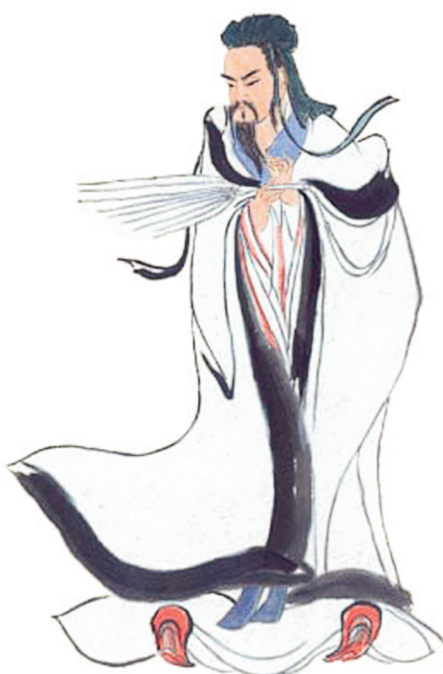
■ 諸葛亮智慧超人，娶妻選丑擇賢。

象，預人事國命，輔佐劉備創立蜀國。他寫的《馬前課》預測了世事和後來歷代朝代的變遷，人們無不稱其神機妙算，智慧超人。