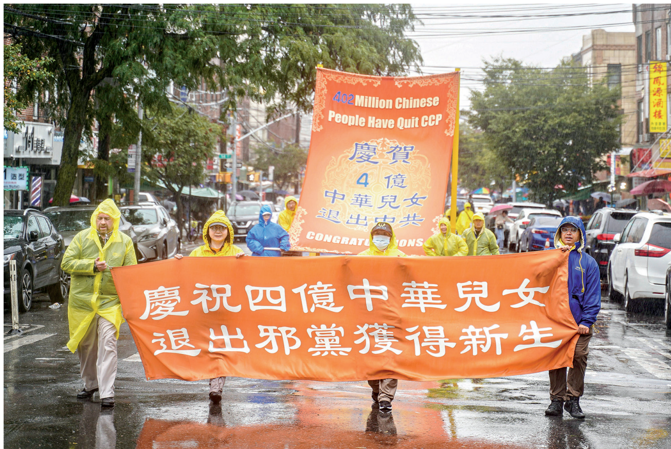
■ 二零二二年十月二日，紐約法輪功學員冒著風雨舉行盛大遊行，傳遞真相，並聲援4億多中國民眾退出中共黨、團、隊組織（三退）。

「你如果讓你的親朋好友做三退，你也功德無量。功德無量就會有福分的。你也是有福分才接到我們的電話的，所以要珍惜這個機會，多做好事。上級再叫你迫害法輪功的時候，你要提前告訴他們（法