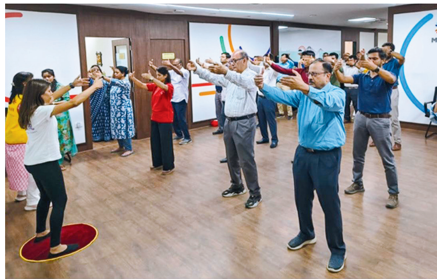
■ 孟買一家地鐵公司員工學煉法輪功第二套功法。