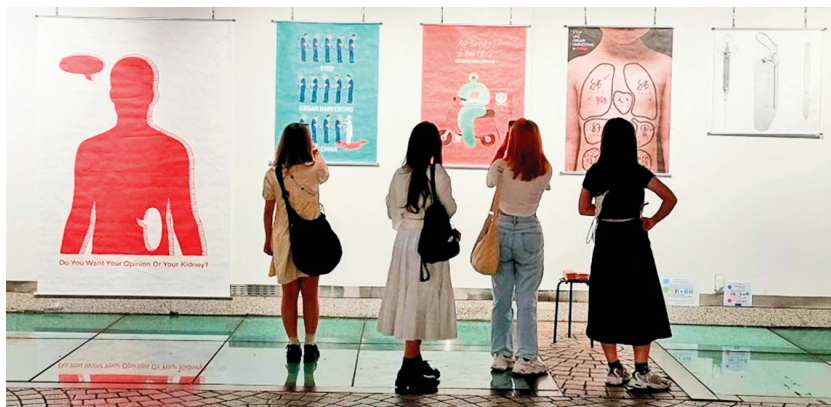
■「制止中共活摘器官海報展」在首爾地鐵美術館舉行。

人們在了解到活摘器官真相及國際社會的動向後，一邊閱讀作品說明等資料，一邊仔細觀看了每幅作品。很多人在拍攝照片和視頻後，上傳到社