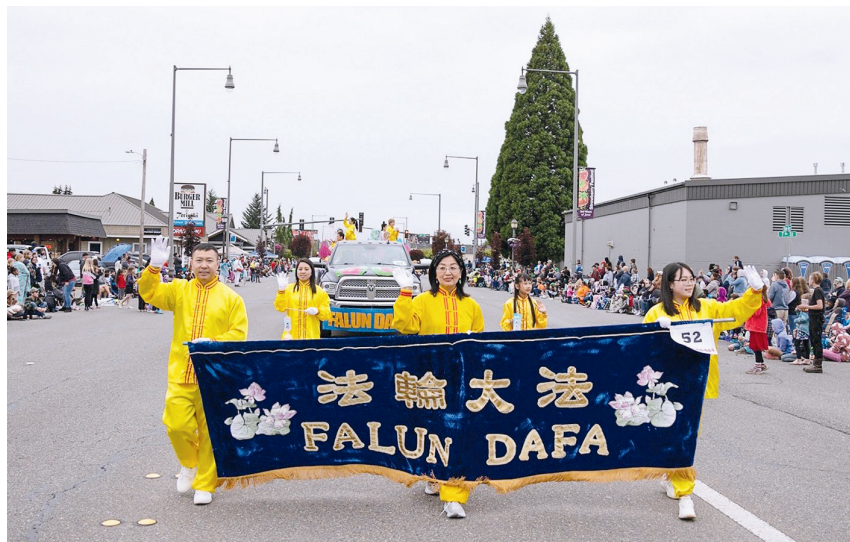
■二零二三年六月十七日，西雅圖法輪功學員參加瑪麗斯維爾市(Marysville)的草莓節遊行活動。

腰鼓隊緊隨花車之後，為觀眾們表演了《法輪大法好》、《喜慶》、《天滅中共》和《新中國進行曲》等曲目。隊員們純善純美的表演感染著觀眾，一曲完畢，人們都熱烈鼓掌歡呼。很多觀眾用英文或中文大喊「Thank You」(謝謝)、「Good Job」(很棒)，還有人在大法隊伍經過時不停地雙手合十鞠躬。