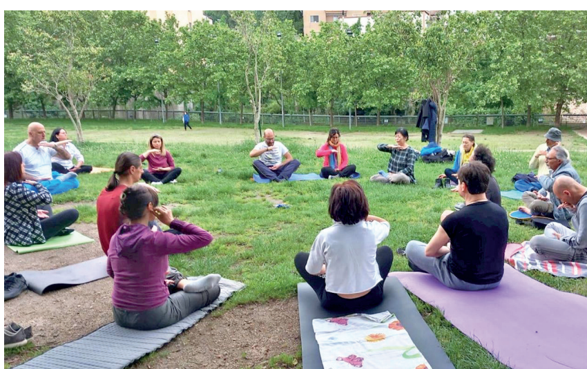
■ 2023年5月21日，在意大利著名海灣風景區的薩萊諾（Salerno）市比諾曹公園（Parco pinocchio），法輪功學員應邀前來為民衆教授法輪功五套功法。圖為民衆學煉第五套功法「神通加持法」。