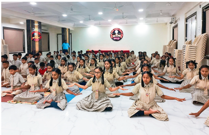
■ 韋蘇瓦市一所學校的學生學煉法輪功。

學員們向大家介紹了法輪功五套功法及修煉對身心健康的好處，師生們學得很快。學員還教他們念誦法輪大法的核心原則——真、善、忍。