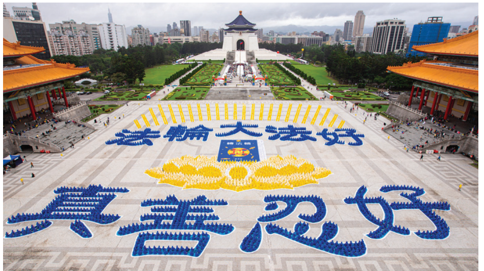
▲ 2020年12月5日，约5,400部分台湾法轮功学员排出九字真言。

我父母一听我炼法轮功了，大惊失色，像天塌了一样，竭力阻止，又联系各方众亲戚来劝阻。父母是部队的军人，深信邪党谎言，根本不听我讲。