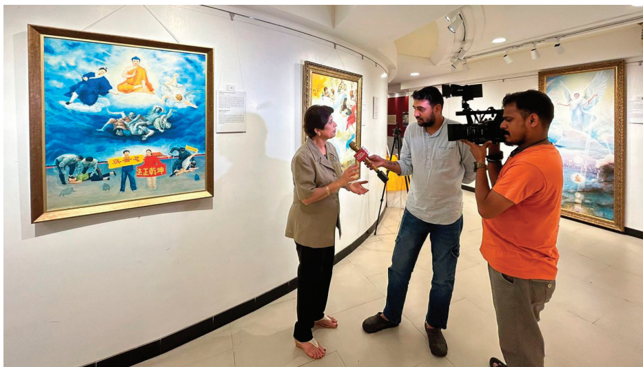
■ Aaj Tak 电视台报道了孟买的“真善忍国际美展”。

她表示这个展览让她了解到，这个世界上正在发生的重要事件。她说：“我很高兴这个画廊举办了这个展览，因为一个小小的举动可以产生巨大的改变。”