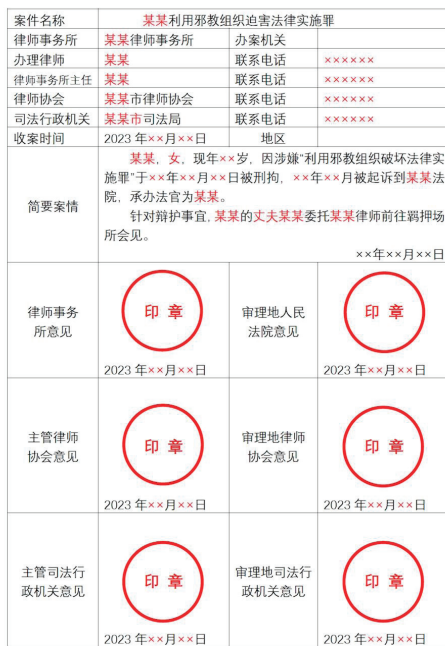
某某违法犯罪案件报备表

也是为打压律师代理所谓敏感案件积累黑材料，是司法机关及其工作人员为非作歹的表现。