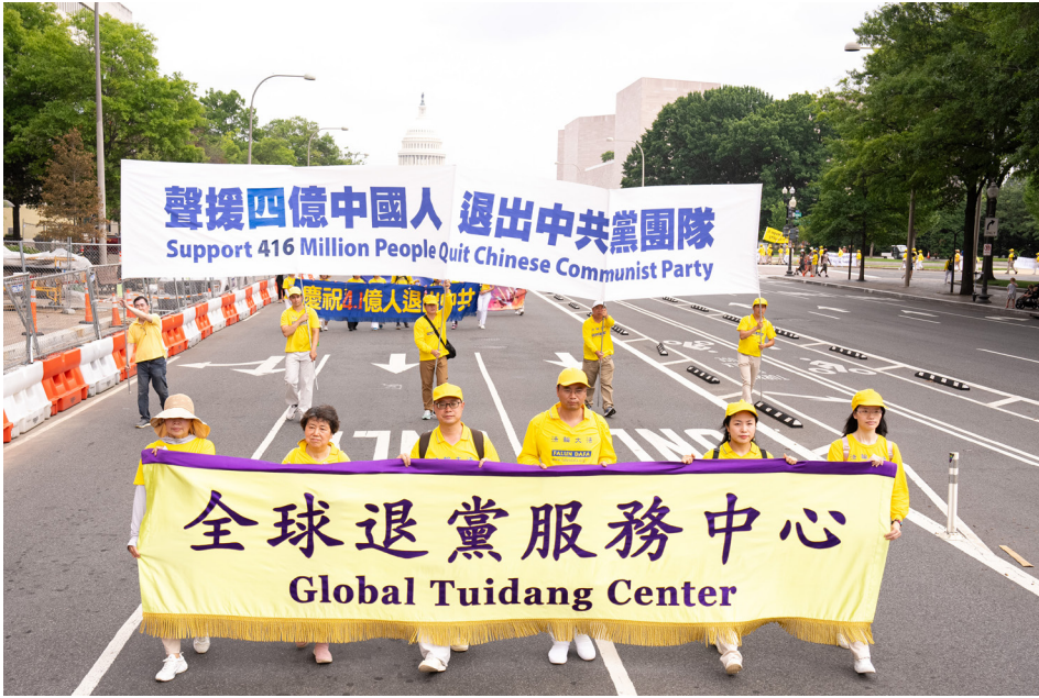
▲ 2023年7月20日,来自全美各地的部分法轮功学员齐聚美国首府华盛顿DC,举行七·二零反迫害游行。