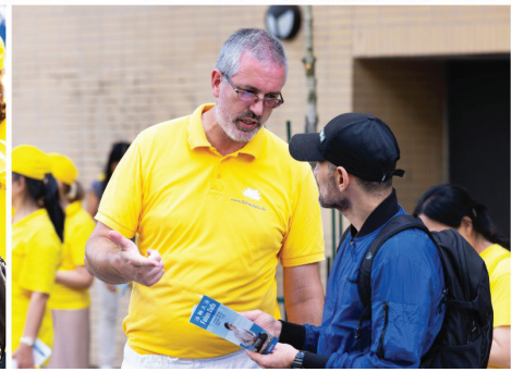
■ 法轮功学员向游行沿途的路人讲述真相。

法轮功学员发声，谴责21世纪最恶劣的种族灭绝事件。“这个事件就是中共对法轮功学员的迫害，尤其是活摘器官。”