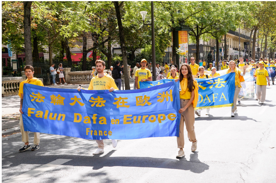
▲ 2023年8月26日，来自欧洲30多个国家的上千名法轮功学员在艺术之都巴黎举行了集会和两场游行，向民众展示法轮大法的美好，同时让人们了解中共迫害法轮功的罪恶。游行队伍所到之处受到沿途民众的称赞。

我说：“我也是位母亲，你就像我的孩子一样。更重要的，我是一名法轮功的修炼者，师父教导我们要与人为善，处处为别人着想，再就是法轮功讲缘分，咱们碰到就是有缘，我不忍心扔下你走，不然我会自责一辈