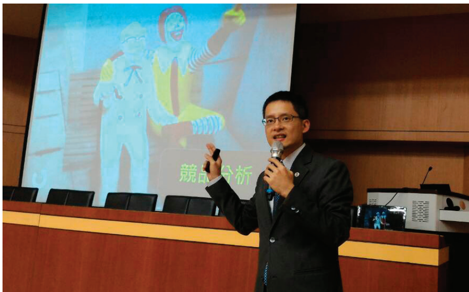
▲ 健豪担任讲师，在经营营销课程中授课。

有一次被骂后，他放下委屈的心情，传讯息给主管说：“请不要放弃对我的指导，我会继续努力。”经过一段时间