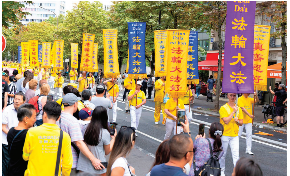
▲ 来自欧洲各国上千名法轮功学员举办游行，队伍从意大利广场出发。

吴先生和太太表示，很多年前就听说过法轮功，也在网上观看过法轮功创始人的教功录像。他们一直想找法轮功的书籍阅读，但苦于不知到哪里去找。他们庆幸自己在这里