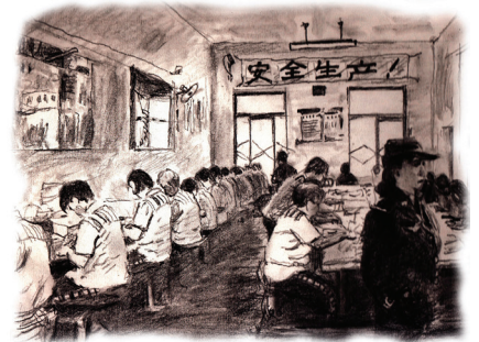
▲ 示意图：中共监狱中的奴工迫害

法轮功教人修心向善，自1992年在中国传出，至今已弘传至100多个国家和地区，受到各族裔民众的赞誉。