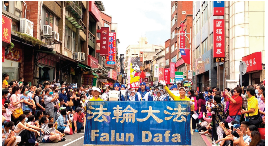
■ 法轮功学员组成的天国乐团受到街道两旁观众的欢迎。