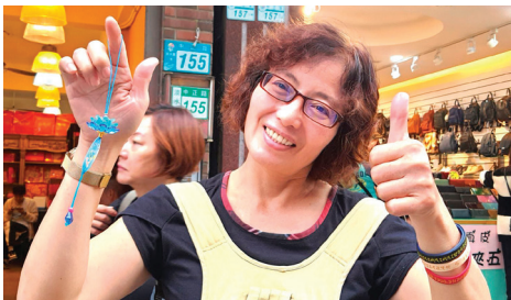
▲ 林女士看到天国乐团非常高兴。

仙女队跟随在天国乐团队伍后方，沿路发放印着“法轮大法好”字样的莲花吊饰，人们爱不释手，团团围住仙女争相拿取，吊饰供不应求。