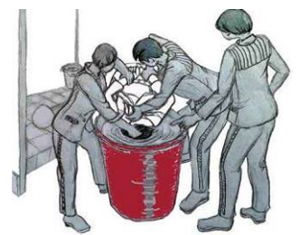
酷刑图：做奴工；长时间罚坐小板凳；用凉水浇冻；罚站；推到厕所灌凉水