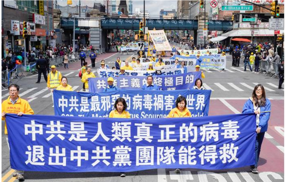
2023年4月24日，法轮功学员在纽约法拉盛举行盛大游行，纪念“四·二五”和平上访二十四周年。