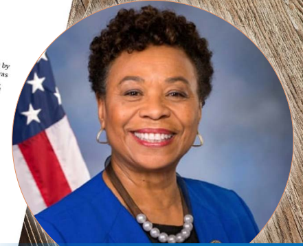
美国资深国会议员芭芭拉·李