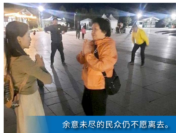
余意未尽的民众仍不愿离去。