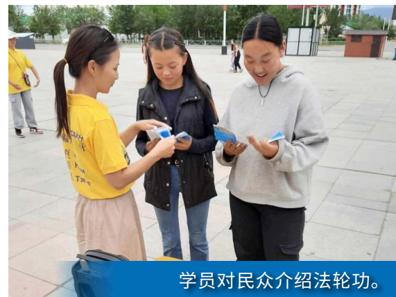
学员对民众介绍法轮功。