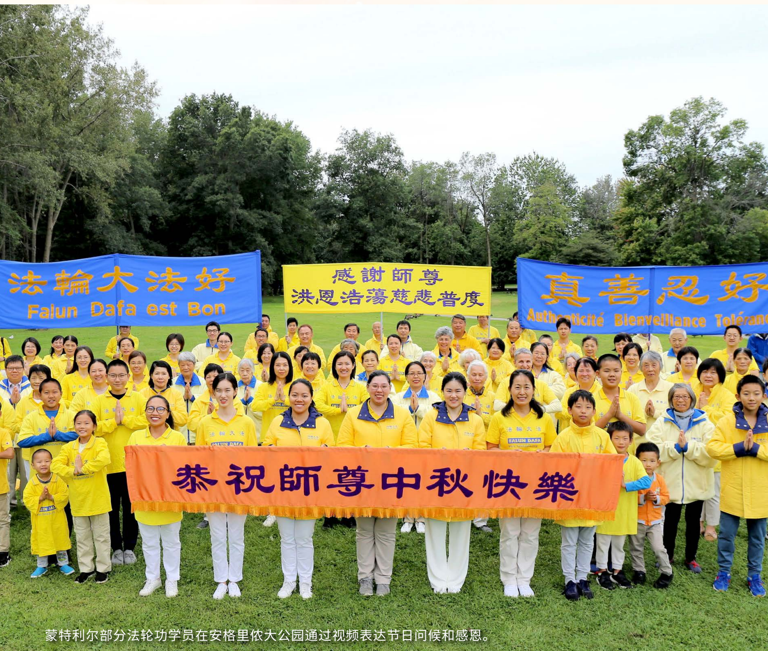
蒙特利尔部分法轮功学员在安格里侖大公园通过视频表达节日问候和感恩。

在2023年中秋佳节之际，加拿大魁北克部分法轮功学员怀着诚挚和感恩的心情，通过视频恭祝法轮大法创始人中秋快乐，感谢师父传法轮大法于世人，给生命带来希望。学员们表示，法轮大法教导“真、善、忍”准则，令人身心受益巨大。