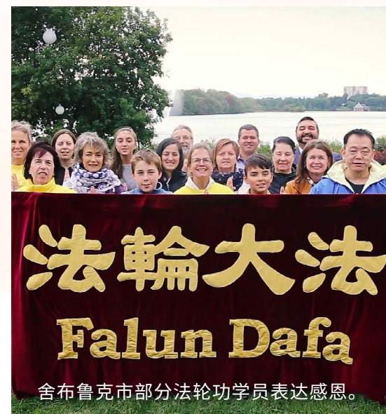
舍布鲁克市部分法轮功学员表达感恩。