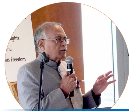
前印度大使普拉蒂普·卡珀尔