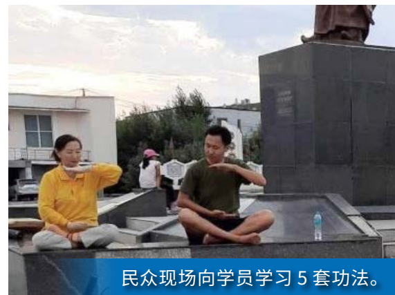
民众现场向学员学习5套功法。

们则咨询如何学功，并向学员学习5套功法，直到傍晚天黑了，还有人不愿离去，和学员了解更多的信息。■