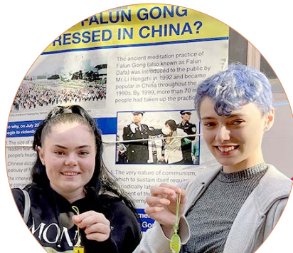
大学生艾蜜（右）和她的朋友

他鼓励学员们坚持下去，他表示：“时间会证明一切，20多年反迫害是不容易的，人们终有一天会知道法轮功是对的。”